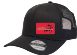
Casquette – Adulte