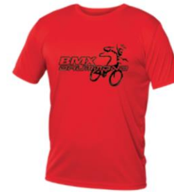
T-shirt dryfit – Enfant $25.00