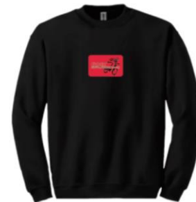
Crewneck – Adulte unisexe