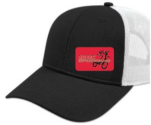
Casquette – Enfant $25.00