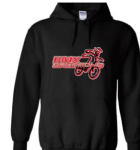
Hoodie – Adulte unisexe