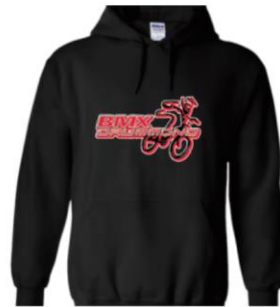
Hoodie – Enfant $45.00