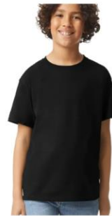
T-shirt coton – Enfant $20.00